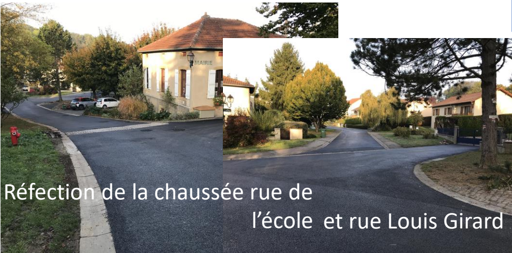
Réfection de la chaussée rue de l'école et rue Louis Girard

Article de notre correspondant du Républicain Lorrain