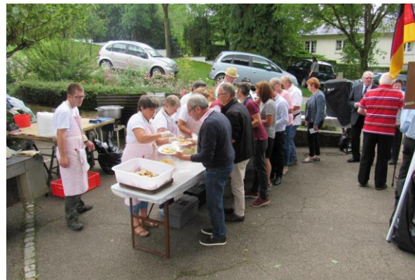
Repas préparé et servi par les Cochoneux de la Seille