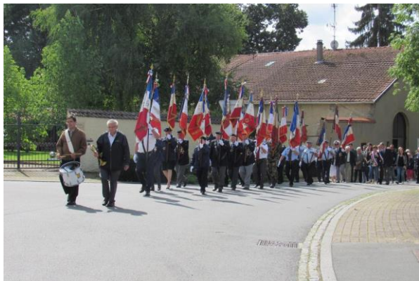
Départ en cortège au monument