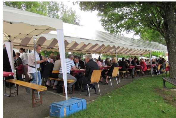
Un peu plus de 140 personnes ont pris place sous le chapiteau