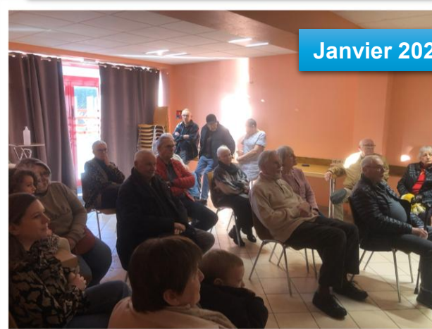
Janvier 2026 : Vœux du Maire