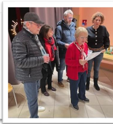
Décembre 2025 : Vente de crêpes à Gisingen et Partage du vin chaud de l'amitié