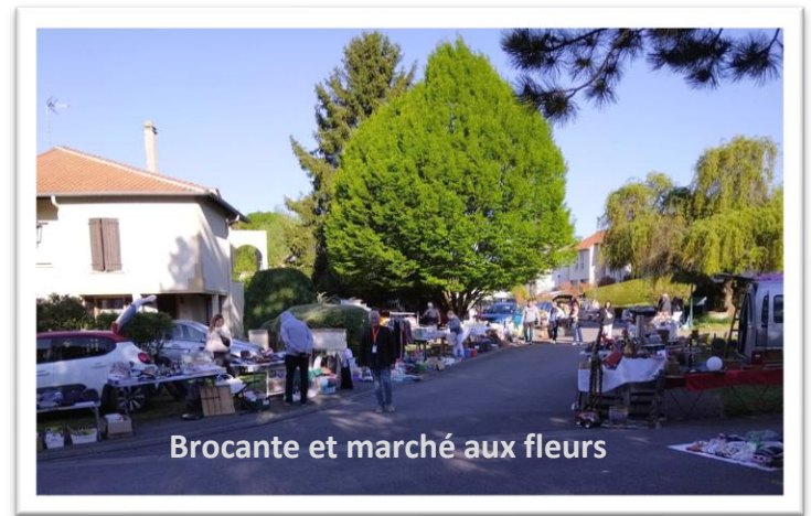
Brocante et marché aux fleurs