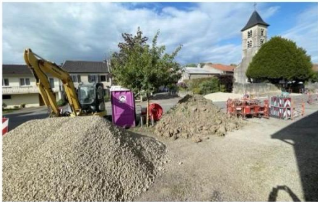
Les Meyens devront faire preuve d'un peu de patience avant de découvrir la nouvelle place du village.

Depuis quelques jours et pour une durée d'environ douze semaines, la municipalité de Mey a programmé des travaux de requalification de la place de l'Église afin que chacun y ait sa place: piétons et voitures.